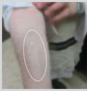
גרייט די הצלה ביי די האנט...